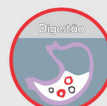
Proteínas Hidrolisadas e Isoladas